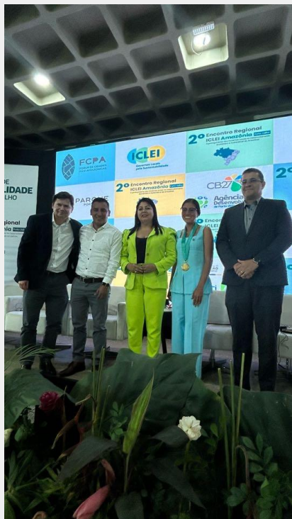
Créditos: Raquel Gonçalves